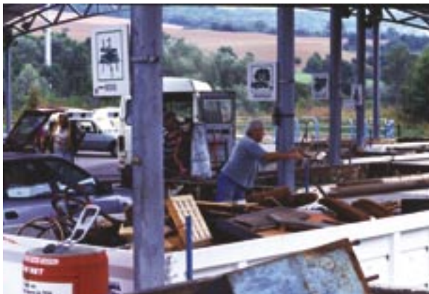
Des conteneurs signalés par des pictogrammes reçoivent les déchets apportés par les particuliers, dans cette déchèterie de Meurthe-et-Moselle.

La déchèterie est un espace aménagé et clôturé où les particuliers peuvent déposer gratuitement leurs déchets occasionnels et principalement les déchets encombrants. Près de 3000 déchèteries étaient déjà en fonctionnement en 2001.